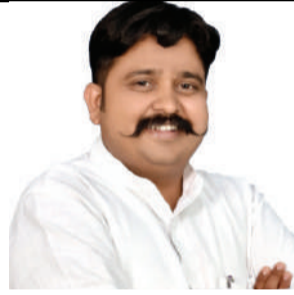
संपादक- गोपाल गावंडे

हालांकि इस दिशा में पहलकदमी के प्रयास पहले से चल रहे थे और उम्मीद थी कि अंतरराष्ट्रीय स्तर पर खड़ी हो रही आर्थिक चुनौतियों और बदलते समीकरण के बीच भारत और यूएई इस मामले में कोई ठोस कदम उठाने जा रहे हैं। लेकिन इसी क्रम में प्रधानमंत्री की यूएई की ताजा यात्रा के दौरान दोनों देशों के बीच अपनी अपनी मुद्रा में कारोबार को बढ़ावा देने पर हुआ करार अब वैश्विक