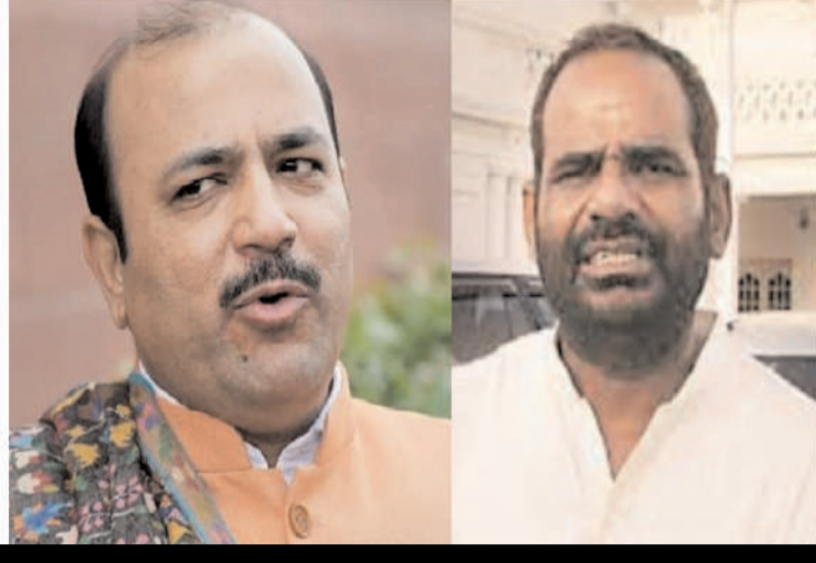
संसद के पटल और मुहल्ले के नुकड़ पर चल रही बहस में अंतर महसूस नहीं होता

नफरती बयानों पर सख्त रुख दिखाते हुए सर्वोच्च न्यायालय कई मौकों पर इसे रोकने का निर्देश दे चुका है, मगर स्पष्ट है कि राजनेताओं ने इसे कमी गंभीरता से नहीं लिया। अब तो शायद सार्वजनिक मंचों पर भाषा की मर्यादा का भी खयाल रखने की जरूरत नहीं समझी जाती। इसी का नतीजा है कि सड़क की भाषा उठ कर संसद में पहुंच गई। दक्षिणी दिल्ली से भाजपा के सांसद रमेश बिधुड़ी ने संसद में अपने ही साथी, बसपा सांसद के बारे में जैसे अपमानजनक और अशोभन शब्दों का इस्तेमाल किया, वैसा अब तक कमी नहीं किया गया। इसे लेकर स्वाभाविक ही विपक्षी दल सरकार पर हमलावर हैं।