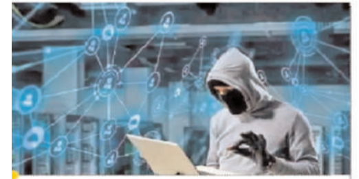
समान बेचने के नाम पर ठगा उन्होंने मोबाइल बंद कर लिया।

इंदौर की ही युवती से 20 हजार की ठगी हुई। युवती को फोन पर कहा गया कि गलती से आपके खाते में 20 हजार रुपए भेज दिए हैं। आप हमें 5-5 हजार करके भेज दें। ठगों ने 10 हजार भेजे थे। हमने 20 हजार भेज दिए। इसके बाद