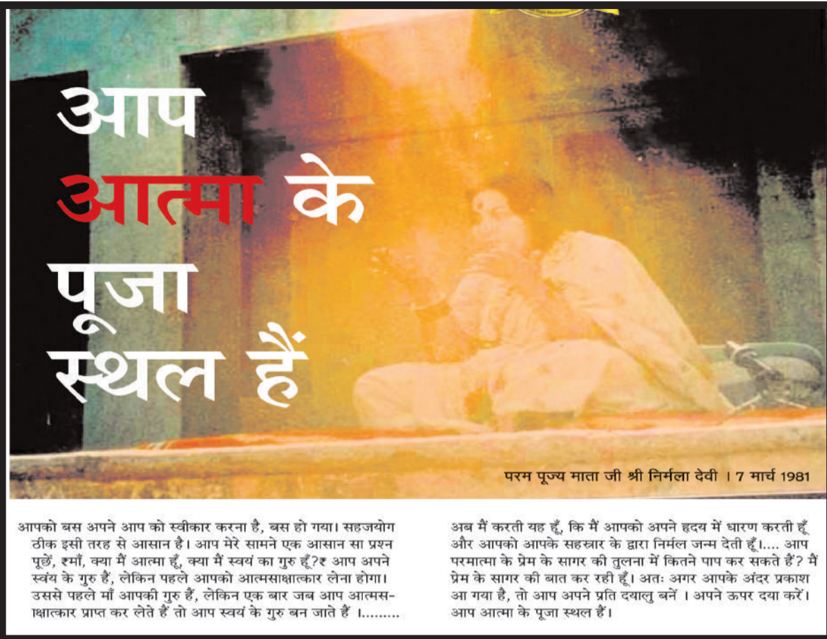
परम पूज्य माता जी श्री निर्मला देवी । 7 मार्च 1981