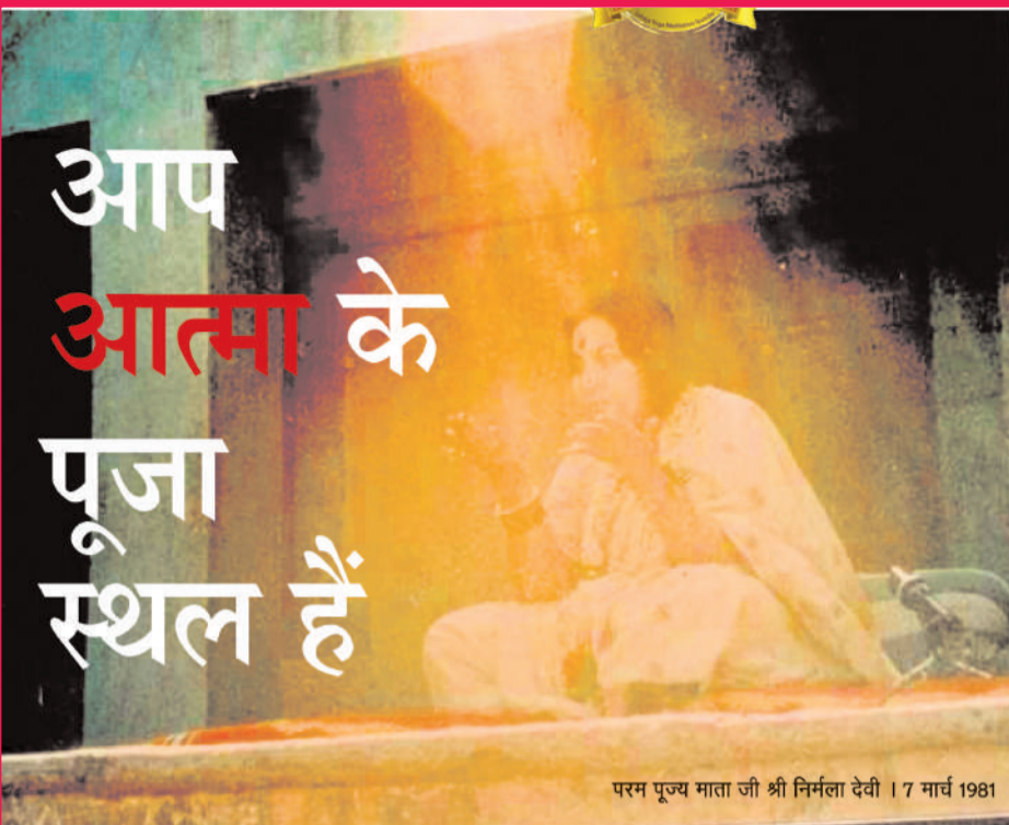
परम पूज्य माता जी श्री निर्मला देवी | 7 मार्च 1981