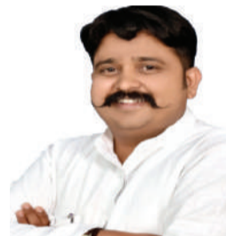
संपादक- गोपाल गावंडे

राजनीतिक अंतर्विरोध इस बार पार्टियों पर खास परिवारों के दबदबे की ही नहीं, एक परिवार के अंदर विरासत पर अलग-अलग