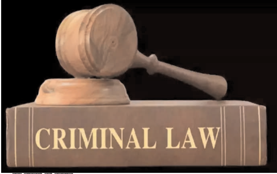
ट्रक ड्राइवरों का हड़ताल

देश में तीन नए कानूनों की वकालत चीफ जस्टिस ऑफ इंडिया डी वाई चंद्रचूड़ ने भी की है। उन उन्होंने इसे युगांतकारी बताया है। ये तीन कानून सिस्टम का कार्यापलट कर सकते हैं। देश के क्रिमिनल जस्टिस सिस्टम में प्रस्तावित आमूल बदलाव को उस समय काफी ताकत मिली, जब शनिवार को षष्ठ्य डी वाय चंद्रचूड़ ने उसे युगांतकारी बताया। इस बदलाव का मुख्य वाहक बन रहे तीन कानून - भारतीय न्याय संहिता भारतीय नागरिक सुरक्षा संहिता और भारतीय साक्ष्य अधिनियम - न केवल संसद के दोनों सदनो से पारित हो चुके हैं बल्कि उन्हें राष्ट्रपति की मंजूरी भी मिल चुकी है। ये कानून इस साल एक जुलाई से लागू होने वाले हैं। षष्ठ्य के बयान की अहमियत इस मायने में है कि प्रस्तावित बदलावों को लेकर समाज के कुछ हिस्सों में कुछ आशंकाओं के भी संकेत मिलते रहे हैं।