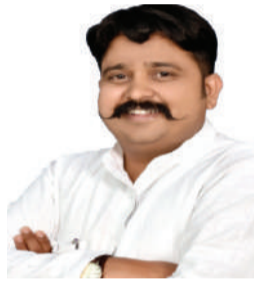
संपादक- गोपाल गावंडे

पार्टियां भी सख्ती करें = समाज में प्रचलित धारणाएं और पूर्वाग्रह भी अक्सर नेताओं पर हावी हो जाता है। लेकिन, उनका कहा-किया एक बड़े तबके पर असर डालता है। इसलिए उन्हें ज्यादा संवेदनशील होने की जरूरत है। साथ ही, राजनीतिक दलों की ओर से भी ऐसे नेताओं पर सख्ती की दरकार है।