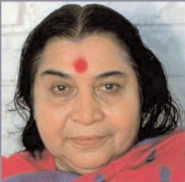
परम पूजनीय श्री माताजी श्री निर्मला देवी 1982