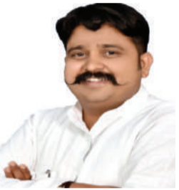
संपादक- गोपाल गावंडे

रणजीत टाइम्स इस पावन अवसर पर आप सभी से अपील करता है कि आइए हम सभी मिलकर अपने धार्मिक और सांस्कृतिक मूल्यों के प्रति आदर और उत्साह के साथ आगे बढ़ें, नवरात्रि और हिंदू नव वर्ष के इस पवित्र अवसर पर नई उम्मीदों और सपनों को साकार करें। यह समय है उन सभी रीति-रिवाजों और परंपराओं का सम्मान करने का, जो हमें हमारे पूर्वजों से विरासत में मिले हैं, और इसे एक ऐसा अवसर बनाने का, जो हमारी साझा संस्कृति और विविधता को मनाता है। हमें यह समझना होगा कि हमारी विविधता ही हमारी सबसे बड़ी ताकत है, और यही वह बात है जो हमें विश्व के अन्य समाजों से अलग बनाती है। चलिए, हम इस नव वर्ष में सम्मान, करुणा, और सामाजिक सद्भावना के भाव को अपनाएं, और एक स्वस्थ, समृद्ध, और सौहार्दपूर्ण समाज के निर्माण में अपना योगदान दें। रणजीत टाइम्स के माध्यम से, हम आपको नवरात्रि और हिंदू नव वर्ष के इस शुभ अवसर पर व्यक्तिगत और सामूहिक स्तर पर संकल्पों को निभाने की प्रेरणा देना चाहते हैं। आइए हम सभी मिलकर इस अवसर को यादगार और सार्थक बनाएं, अपने आस-पास के वातावरण और समाज को बेहतर बनाने के लिए आवश्यक कदम उठाएं। इस नववर्ष, आपके सभी सपने और आशाएँ साकार हों, और आपका जीवन सुख, शांति, और समृद्धि से भर जाए। संपादकीय टीम की ओर से, आप सभी को चैत्र नवरात्रि और हिंदू नव वर्ष की ढेर सारी शुभकामनाएँ।