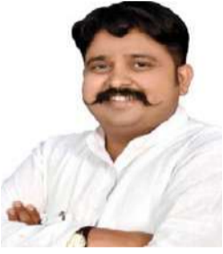
संपादक- गोपाल गावंडे

पिछले कुछ वर्षों से जिस तरह मौसम का रुख कृषि क्षेत्र के लिए अनुकूल नहीं दिखाई दे रहा है, उसमें आने वाले समय में इसे लेकर कितना भरोसा किया जा सकता है। ऐसे में, फिर से यह जरूरत रेखांकित हुई है कि फसलों की सुरक्षा, भंडारण, शीतगृहों की क्षमता बढ़ाने आदि जैसे जरूरी उपायों पर गंभीरता से ध्यान दिया जाना चाहिए। महंगाई पर काबू पाने के लिए केवल रिजर्व बैंक की नीतिगत दरें पर्याप्त उपाय नहीं हैं।