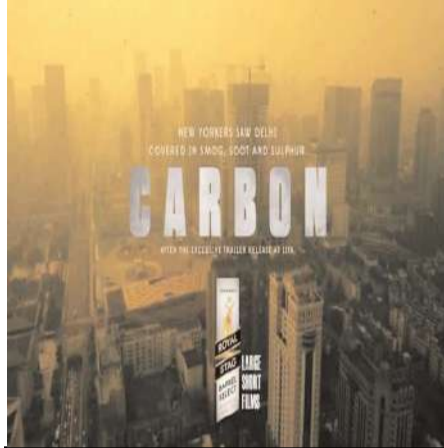
कार्बन ए स्टोरी ऑफ टुमारो

साल 2003 में आई फिल्म मातृभूमि- ए नेशन विदाउट वुमन में ट्यूलिप जोशी और सुशांत सिंह ने अहम रोल निभाया था। इस मूवी को आप यूट्यूब पर देख सकते हैं।