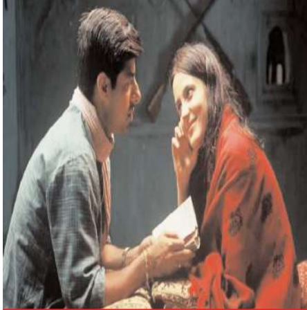
मातृभूमि ए नेशन विदाउट वुमन

साउथ इंडस्ट्री के सुपरस्टार प्रभास की फिल्म कल्कि 2898 एडी हाल ही में बड़े पर्दे पर रिलीज हुई है। इस मूवी को साउथ से लेकर नॉर्थ बेल्ट तक के दर्शकों ने भरपूर प्यार दिया है। वहीं दुनियाभर में कल्कि 2898 एडी ने ऐसा धमाल मचाया है कि सभी लोग दंग रह गए हैं। बॉक्स ऑफिस पर कल्कि 2898 एडी आए दिन कोई न कोई रिकॉर्ड तोड़ रही है। अगर आपको भी कल्कि 2898 एडी पसंद आई है तो आप इन सात डायस्टोपियन फिल्मों का मजा घर बैठे ओटीटी या यूट्यूब पर ले सकते हैं। आइए नजर डालते हैं इस लिस्ट पर-