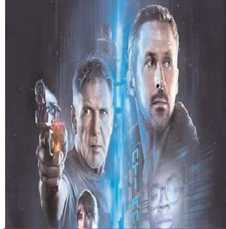
ब्लेड रनर 2049

नवाजुद्दीन सिद्दीकी, जैकी भगनानी और प्राची देसाई की फिल्म कार्बन- ए स्टोरी ऑफ टुमारो को आप अमेजन प्राइम वीडियो पर देख सकते हैं। बता दें कि ये फिल्म 2017 में रिलीज हुई थी।