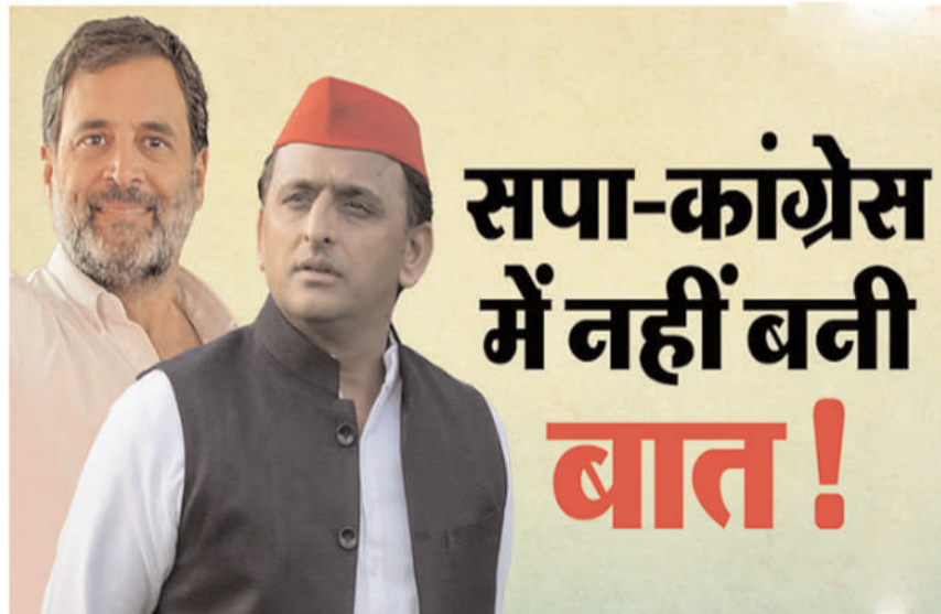
Haryana Assembly Election 2024

अखिलेश यादव ने मध्य प्रदेश में 24 रैलियां की थीं। इन रैलियों में अखिलेश के निशाने पर भाजपा से ज्यादा कांग्रेस रही थी। हालांकि समाजवादी पार्टी को मध्य प्रदेश में एक भी सीट नहीं मिली, लेकिन समाजवादी पार्टी के वोट काटने की वजह से कांग्रेस जरूर चार सीटों