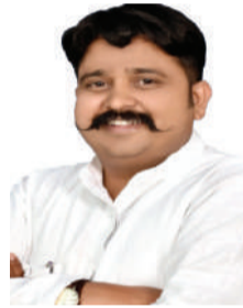
संपादक- गोपाल गावंडे

स्थिति की जटिलता का अंदाजा इस बात से लगता है कि एक दशक पहले यानी 2014 में हुए विधानसभा चुनाव के समय अनुच्छेद 370 के तहत विशेष दर्जे से लैस जम्मू-कश्मीर अब राज्य के दर्जे से भी वंचित है। उस चुनाव में दो सबसे बड़ी और मिलकर सरकार बनाने वाली पार्टियां – PDP और BJP – एक-दूसरे की धुर विरोधी हो चुकी हैं। नए दौर की उम्मीद जम्मू-कश्मीर एक राज्य के रूप में शुरू से विशिष्ट रहा है। इसकी तुलना अन्य राज्यों में होने वाले चुनावों से नहीं की जा सकती। बड़ी बात यह है कि पार्टियां एक-दूसरे के बारे में चाहे जो भी कहें, ये सभी भारतीय संविधान के तहत लोकतांत्रिक ढंग से चुनाव में हिस्सेदारी कर रही हैं और जनादेश को भी स्वीकार करेंगी। सबकी नजरें ईवीएम से निकलने वाले इसी जनादेश पर हैं। उम्मीद है कि यहां से जम्मू-कश्मीर में लोकतांत्रिक विकास और शांति-समृद्धि का नया दौर शुरू होगा।