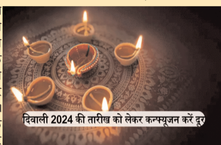
दिवाली 2024 की तारीख को लेकर कन्फ्यूजन करें दूर

दीपावली 2024 पर इस साल जैसी ही परिस्थिति 1963 में भी हुई थी, तब पिछले दिन ही दीपावली मनाई गई थी। देश के पुराने श्रीमद् बापूदेव शास्त्री पंचांग की 1963 की फोटों पर नजर डालें, तो समझ आएगा। श्रीपंचदशनाम जूना अखाड़े के सचिव, अंतरराष्ट्रीय प्रवक्ता और