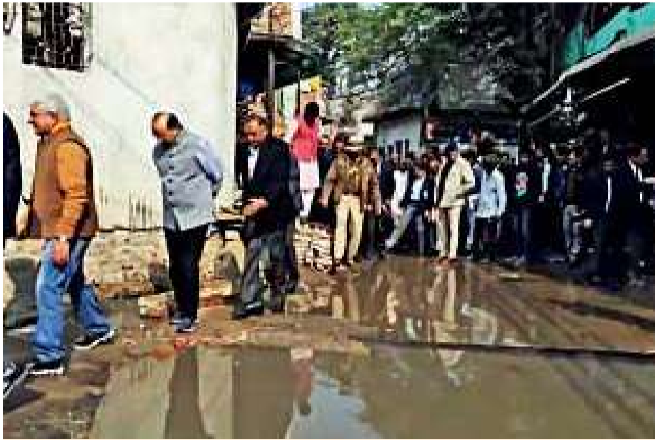
LG ने एक्स पर विडियो शेर कर रंगपुरी पहाड़ी और कापसहेड़ा इलाके की बदहाली पर सरकार को घेरा। सुधार के लिए अधिकारियों को निर्देश भी दिए।

से शुक्रिया अदा करना चाहता हूँ। उन्होंने जो भी कमियाँ निकाली हैं, उन सारी कमियों को हम दूर करेंगे। मुझे याद है कि वह नांगलोई-मुंडका रोड पर भी गए थे। उन्होंने कहा था कि वहाँ पर गड्डे हैं। अब वहाँ सड़क बननी चालू हो गई है और थोड़े दिन में मुख्यमंत्री आतिशी वहाँ जाकर उसका शुभारंभ भी करेंगी। आज भी उन्होंने जो बताया है, हम वहाँ सफाई कराएंगे। मेरा एलजी साहब से निवेदन है कि वह हमें हमारी कमियाँ बताएं और हम वो सारी कमियाँ दूर करेंगे।' उधर, शाम को सीएम आतिशी ने रंगपुरी पहाड़ी जाकर लोगों से मुलाकात की और उनकी समस्याएं जानीं। कहा कि सड़क और बिजली की समस्या का जल्द समाधान होगा।