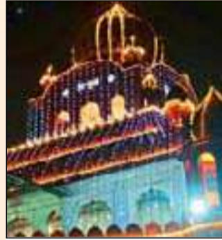
फतेहगढ़ साहिब गुरुद्वारा

22 दिसंबर को चमकौर की लड़ाई शुरू हुई जिसमें सिख और मुगलों की