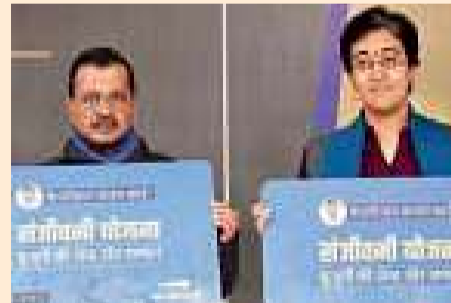
लोगों को दिया जाने वाला 'केजरीवाल कवच कार्ड' भी लॉन्च किया गया।

आम आदमी पार्टी के कार्यकर्ता और वॉलंटियर्स सोमवार से मुख्यमंत्री महिला सम्मान राशि और बुजुर्गों के फ्री इलाज की संजीवनी योजना के लिए घर-घर जाकर रजिस्ट्रेशन शुरू करेंगे। पार्टी के राष्ट्रीय संयोजक अरविंद केजरीवाल ने रविवार को प्रेस कॉन्फ्रेंस करके इसकी घोषणा की। साथ ही रजिस्ट्रेशन के बाद लोगों को दिया जाने वाला 'केजरीवाल कवच कार्ड' भी लॉन्च किया। कार्यकर्ता महिलाओं और बुजुर्गों की जानकारी लेकर उन्हें एक कार्ड देंगे। 18 साल से अधिक उम्र की महिलाओं को योजना के तहत हर महीने 2100 रुपये की आर्थिक