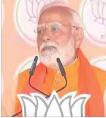
दिल्ली में भाजपा सरकार बनने जा रही है। इस बार पूरी दिल्ली कह रही है- अबकी बार मोदी सरकार। साथियों दिल्ली की आपदा

नई दिल्ली (एजेंसी)। दिल्ली विधानसभा चुनाव प्रचार के लिए प्रधानमंत्री नरेंद्र मोदी रविवार को दिल्ली पहुंचे। पीएम ने आरके पुरम में करीब 1 घंटे जनता को संबोधित किया। इस दौरान मोदी ने आप-दा और कांग्रेस पार्टी की आलोचना की। पीएम ने रैली की शुरुआत देशवासियों को बसंत पंचमी की बधाई के साथ की। मोदी ने कहा- बसंत पंचमी के साथ ही मौसम बदलना शुरू हो जाता है। तीन दिन बाद 5 फरवरी को दिल्ली में विकास का नया बसंत आने वाला है। दिल्ली में वोटिंग से पहले ही झाड़ू के तिनके बिखर रहे हैं। आपदा के लीडर्स उसे छोड़कर जा रहे हैं। आपदा पार्टी ने यहां के 11 साल बर्बाद कर दिए हैं। सरकार वो अच्छी है जो बहाने बनाने के बजाय दिल्ली को सजाने-संवारने में ऊर्जा लगाए। इस बार