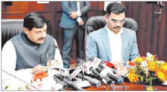
बढ़ावा दिया जाएगा। मुख्यमंत्री डॉ. यादव ने इस पहल को राज्य के युवाओं के लिए ऐतिहासिक अवसर बताया है। उन्होंने कहा कि मध्य प्रदेश कौशल विकास की नई ऊंचाइयों को छूने के लिए तैयार है।

भोपाल। मुख्यमंत्री डॉ. मोहन यादव ने कहा है कि प्रधानमंत्री नरेंद्र मोदी के आत्मनिर्भर भारत अभियान को सशक्त करते हुए केंद्रीय बजट 2025 में कौशल विकास और रोजगार को केंद्र में रखा गया है। मध्य प्रदेश इस अवसर का लाभ उठाते हुए प्रदेश को कौशल शक्ति प्रदेश के रूप में विकसित करने के लिए तत्पर है। मुख्यमंत्री डॉ. यादव ने कहा कि प्रधानमंत्री नरेंद्र मोदी के मार्गदर्शन में हम एक ऐसा वातावरण तैयार कर रहे हैं, जहां हर युवा को नवीनतम औद्योगिक जरूरतों के अनुसार प्रशिक्षण मिलेगा। इससे प्रदेश की प्रतिभा न केवल राष्ट्रीय बल्कि वैश्विक स्तर पर भी अपनी पहचान बनाएगी। मुख्यमंत्री डॉ. यादव ने कहा कि केंद्रीय बजट-2025 में घोषित 5 राष्ट्रीय कौशल उत्कृष्टता केंद्रों की स्थापना से मध्य प्रदेश को विशेष रूप से लाभ मिलेगा। इन केंद्रों के माध्यम से मेक फॉर इंडिया और मेक फॉर द वर्ल्ड अभियान को मजबूती मिलेगी जिससे राज्य में प्रशिक्षकों के उन्नत प्रशिक्षण, प्रमाणन प्रणाली और उद्योग से जुड़े पाठ्यक्रमों को